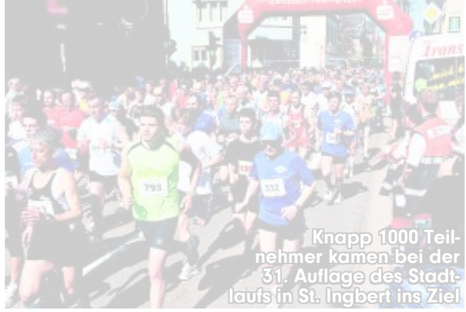
Knapp 1000 Teilnehmer kamen bei der 31. Auflage des Stadtlaufs in St. Ingbert ins Ziel

St. Ingbert - Politiker mit Ausdauer: Saarlands Innenminister Stephan Toscani (43) war beim 31. St. Ingberter Stadtlauf mit am Start.