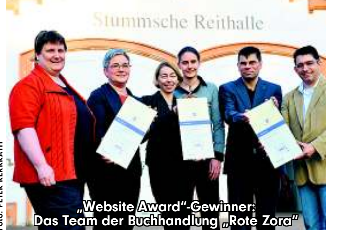
„Website Award“-Gewinner: Das Team der Buchhandlung „Rote Zora“

Neunkirchen - aus Merzig. Das Team setzte sich mit seiner Interaktivität und Authentizität: Das ist das Geheimrezept der Website der Buchhandlung „Rote Zora“