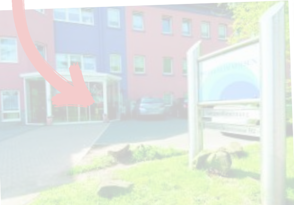
Im Pflegeheim Spiesen hat sich seit der MDK-Kontrolle bereits viel verändert. Auf allen Stationen wurden z. B. Bilder aufgehängt