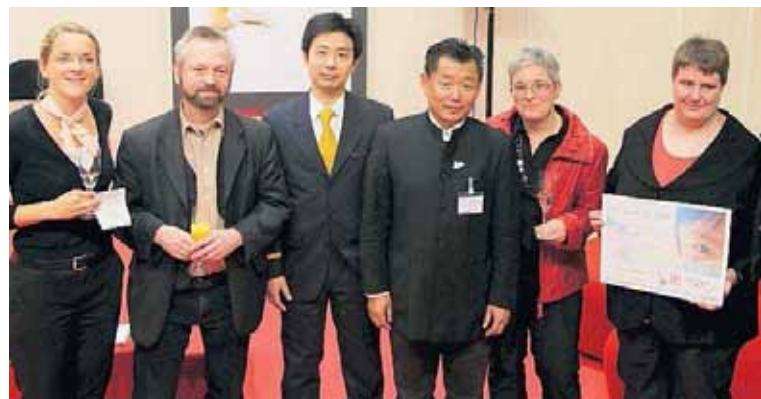
Preisverleihung auf der Frankfurter Buchmesse fürs beste China-Schaufenster.