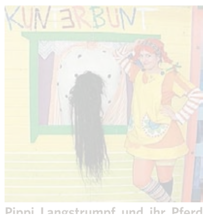
Pippi Langstrumpf und ihr Pferd

• Karten gibt es an allen Ticket-Regional-Vorverkaufsstellen, im Kulturbüro unter Tel. (0 68 61) 8 54 99 (Stadthalle Merzig) sowie im Kreiskulturzentrum Villa Fuchs unter Telefon (0 68 61) 9 36 70 und unter www.villa-fuchs.de. Kinderpreise vier Euro