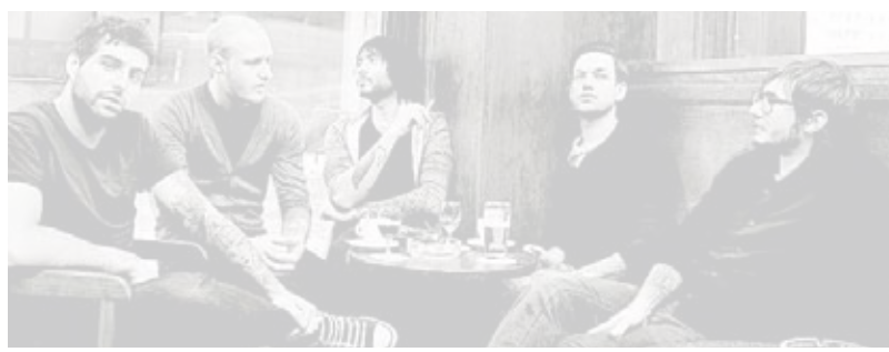
Eternal Tango spielt in Saarbrücken.

Moreira: „Momentan können wir überleben. Vor allem, weil ein Großteil der Band noch bei den Eltern wohnt. Da in Luxemburg das Gehaltsniveau ziemlich hoch ist, liegen wir noch weit unter dem Mindestlohn. Wie weit wir