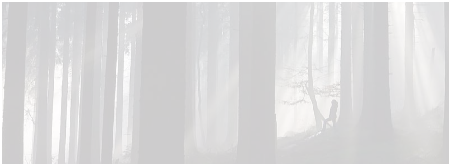
Ein Unfall im Wald: Ein Mensch verschwindet, vier bleiben zurück – so beginnt Holger Montags Thriller.

Redaktion: Telefon (0 68 61) 9 39 66 50 E-Mail redmzg@sz-sb.de Volker Fuchs (vf), Mathias Winters (pum) (beide Regionalleitung) Christian Beckinger (cbe), Wolf Porz (wop), Edmund Selzer (es), Margit Stark (mst) Pressezentrum Poststraße 47, 66663 Merzig Gewerbliche Anzeigen: Telefon (0 68 61) 9 39 66 30 Fax (0 68 61) 9 39 66 39